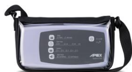
Pochette de transport

4 cellules à air à pression alternée insérées dans une base mousse